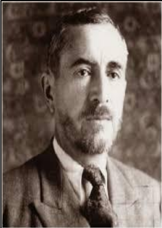
سيد شهداء كردستان القاضي محمد