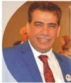
• عقيل التميمي

ثلاثة خطوط اثنان منها في الاراضي الكويتية وحفر الباطن وهي قوات الجيش العراقي والتي كان مخطط لها لتكون كبش فداء والثالث داخل الاراضي العراقية وهي قوات الحرس الجمهوري، افرض رحبنا المعركة البرية فهل ستسكت امريكا فربما تضربنا بالنووي!!! كانت اجابة القائد لضابط ركنه الضحك باستهزاء ثم قال له نفذ واسكت!!! كانت القسوات الامريكية وحلفائها تقصف قوات الحرس الجمهوري داخل الاراضي العراقية حتى انهكته بينما لاتضرب اي طلقه على قواتنا المتواجده داخل الاراضي الكويتية فاضطر الكثير منها الهروب وترك مقراته لعدم وصول الماء والارزاق بسبب قصف الطيران الدولي للجسور والمقرات الخلفية والتي سببت عدم وصول هذه الارزاق... عقليات بانسه وقرارات سخيفة