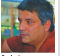
• نوي زهرة